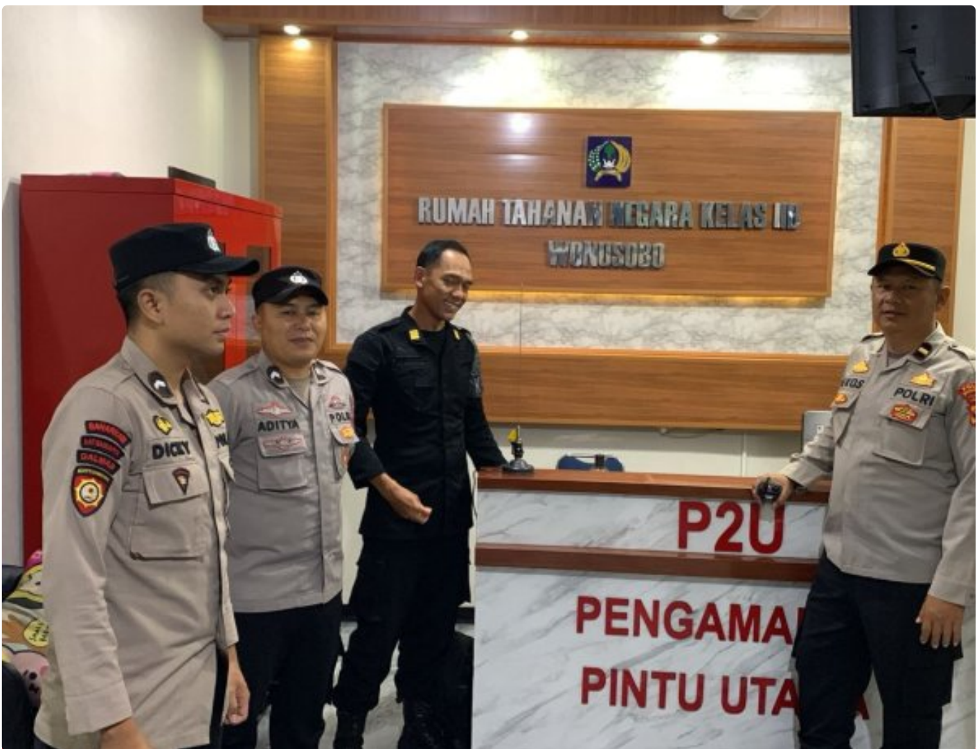
Anggota Polres Wonosobo Sambang Rutan Jelang Nataru, Situasi Aman dan Kondusif

WONOSOBO – Sebagai tindak lanjut atas koordinasi pengamanan Hari Raya Natal 2025 dan Tahun Baru 2026, sinergitas antara Rumah Tahanan Negara (Rutan) Kelas IIB Wonosobo dan Kepolisian Resor (Polres) Wonosobo semakin diperkuat. Hal ini terlihat dari intensitas Patroli Sambang yang dilakukan oleh anggota Polres Wonosobo ke Rutan Wonosobo pada Kamis malam (25/12/2025).