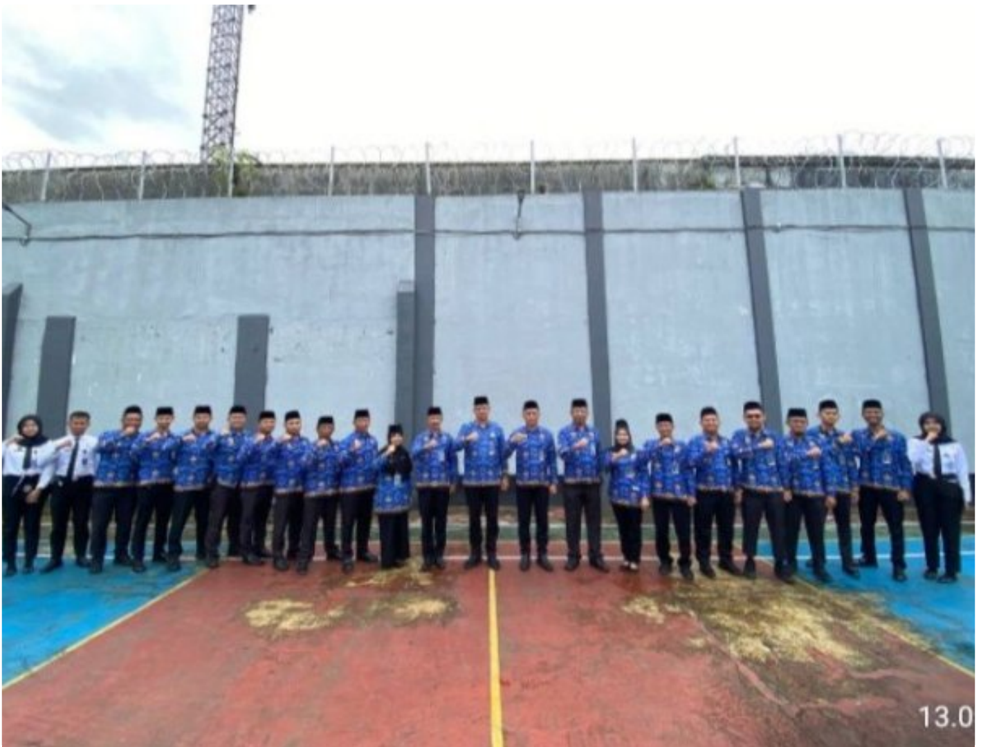
Apel Pagi Bersama, Karutan Wonosobo Tekankan Keamanan Nataru dan Dukungan 15 Program Aksi Kemenimipas

Wonosobo – Rumah Tahanan Negara (Rutan) Kelas IIB Wonosobo melaksanakan apel pagi bersama yang diikuti oleh seluruh pegawai, warga binaan pemasyarakatan, serta peserta magang, pada Selasa, 17 Desember 2025. Kegiatan apel pagi ini berlangsung tertib dan khidmat sebagai sarana