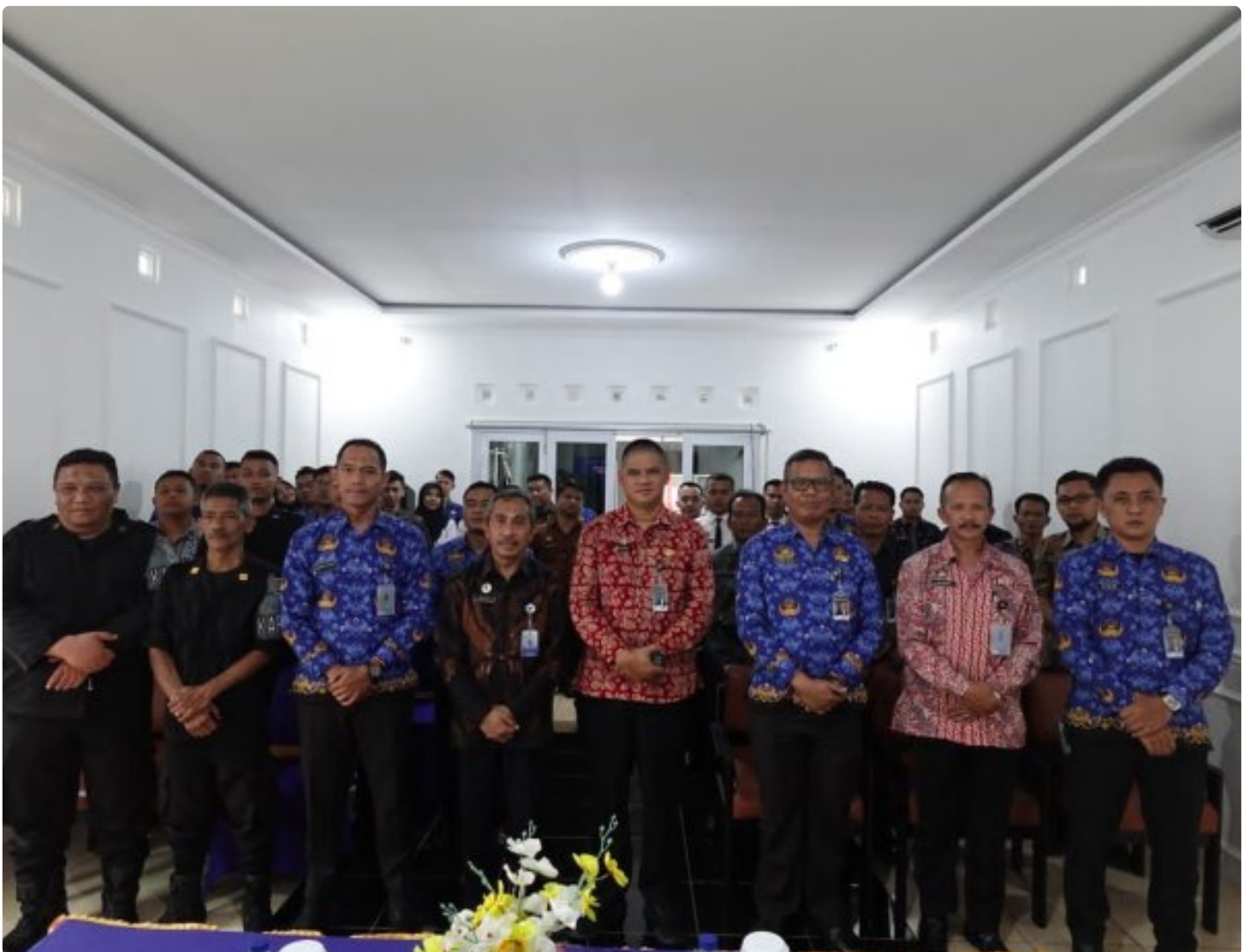
Arahan Kakanwil HAM Jateng Dorong Peningkatan Layanan Berbasis HAM di Rutan Wonosobo