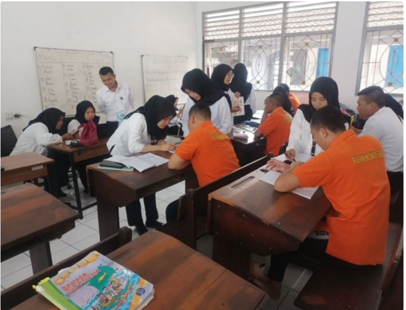
Berantas Buta Huruf, Rutan Wonosobo Gelar Pembinaan Calistung bagi Warga Binaan

Wonosobo – Rumah Tahanan Negara (Rutan) Kelas IIB Wonosobo terus berkomitmen meningkatkan kualitas sumber daya manusia warga binaan melalui program pembinaan kepribadian.