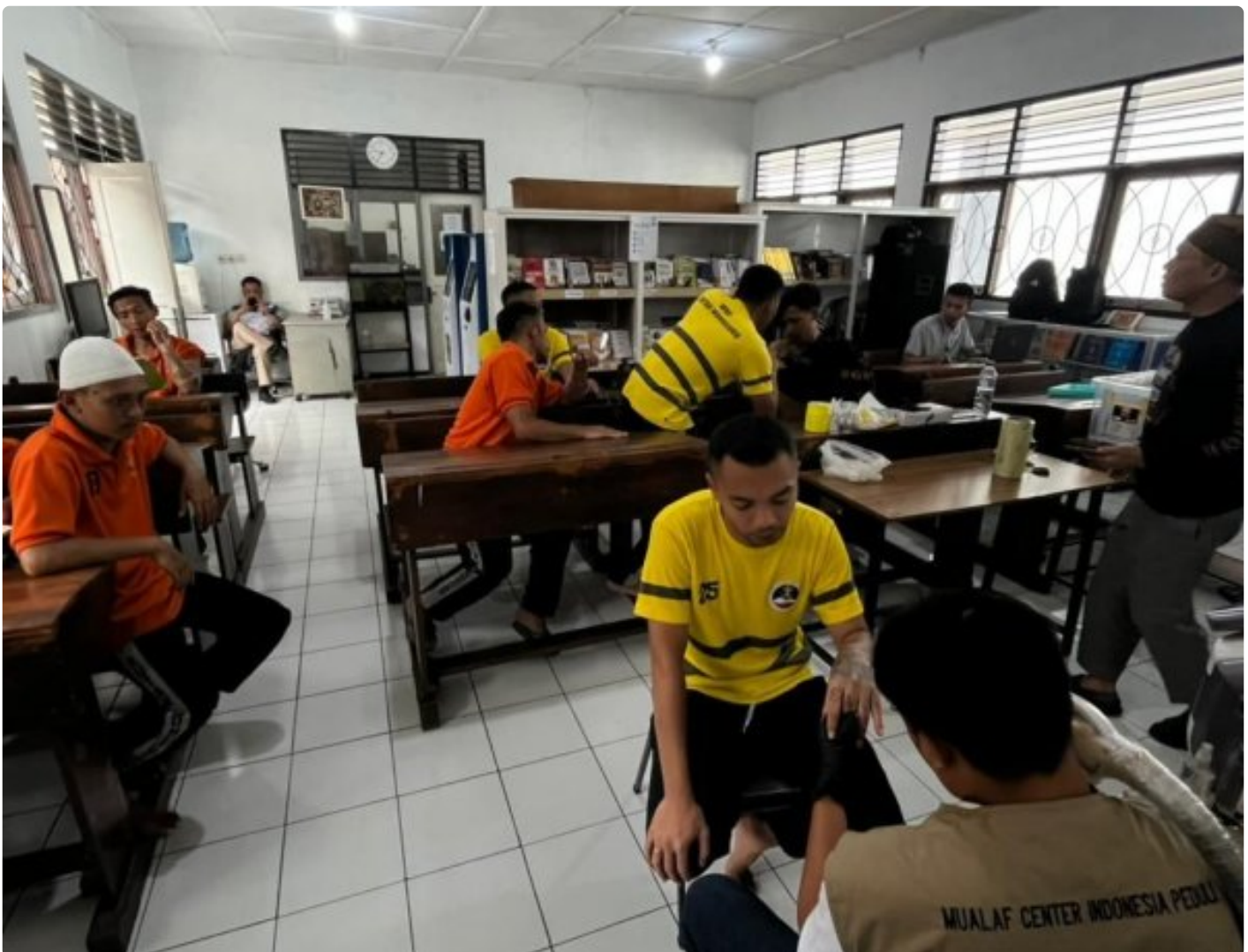
Komunitas Mualaf Center Indonesia Peduli Gelar Kegiatan Penghapusan Tato bagi WBP Rutan Kelas IIB Wonosobo

Wonosobo – Komunitas Mualaf Center Indonesia Peduli melaksanakan kegiatan penghapusan tato bagi Warga Binaan Pemasyarakatan (WBP) di Rutan Kelas IIB Wonosobo sebagai bentuk kepedulian dan dukungan terhadap proses pembinaan kepribadian.