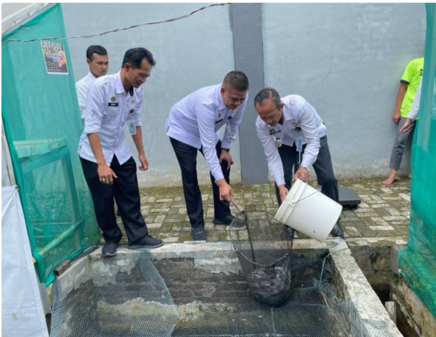
Panen Ikan Lele, Rutan Wonosobo Perkuat Ketahanan Pangan Melalui Pembinaan Kemandirian Bidang Perikanan

Wonosobo – Rumah Tahanan Negara (Rutan) Kelas IIB Wonosobo terus menunjukkan komitmennya dalam mendukung program ketahanan pangan nasional melalui pembinaan kemandirian bagi warga binaan. Pada Rabu, 31 Desember 2025, Rutan Wonosobo melaksanakan kegiatan panen ikan lele