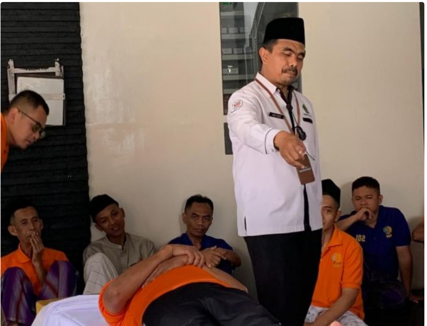
Pembinaan Bermakna di Akhir Tahun, Warga Binaan Rutan Wonosobo Ikuti Pelatihan Pemulasaran Jenazah

Wonosobo – Dalam upaya meningkatkan pembinaan keagamaan dan keterampilan spiritual warga binaan, Rumah Tahanan Negara (Rutan) Kelas IIB Wonosobo bekerja sama dengan Kementerian Agama (Kemenag) Kabupaten Wonosobo menyelenggarakan kegiatan pelatihan pemulasaran jenazah pada