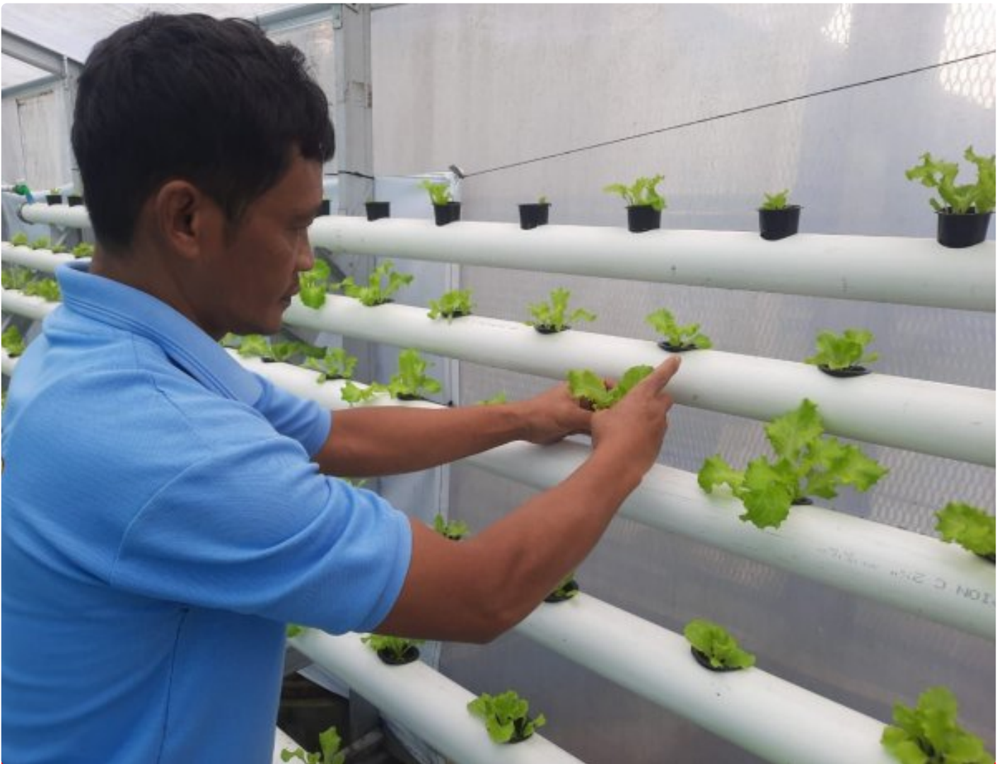
Program Hidroponik Rutan Wonosobo, Solusi Cerdas Atasi Minimnya Lahan

Wonosobo - Rutan Kelas IIB Wonosobo terus mengembangkan program ketahanan pangan melalui budidaya selada dengan metode hidroponik.