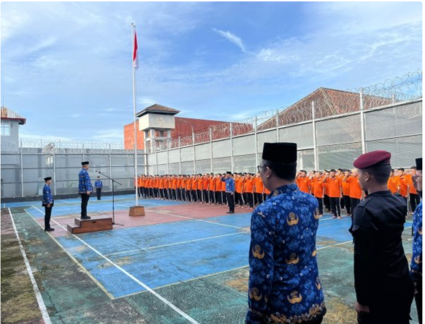
Rutan Wonosobo Gelar Upacara Hari Bela Negara, Wujud Nyata Bela Negara dari Balik Jeruji

WONOSOBO – Rumah Tahanan Negara (Rutan) Kelas IIB Wonosobo melaksanakan upacara peringatan Hari Bela Negara pada Jumat, 19 Desember 2025, sebagai wujud komitmen menanamkan nilai-nilai nasionalisme dan cinta tanah air di lingkungan masyarakat.