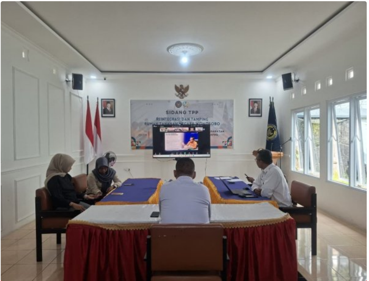
Rutan Wonosobo ikuti Arahan Menteri Terkait Persiapan Pengadaan BAMA TA 2026

Wonosobo – Rumah Tahanan Negara (Rutan) Kelas IIB Wonosobo mengikuti kegiatan Arahan Menteri Imigrasi dan Pemasarakatan terkait Persiapan Pengadaan Bahan Makanan (BAMA) pada Unit Pelaksana Teknis Pemasarakatan Tahun Anggaran 2026. Kegiatan ini dilaksanakan secara virtual pada Kamis, 4 Desember 2025, bertempat di Aula Sikunir Rutan Wonosobo.