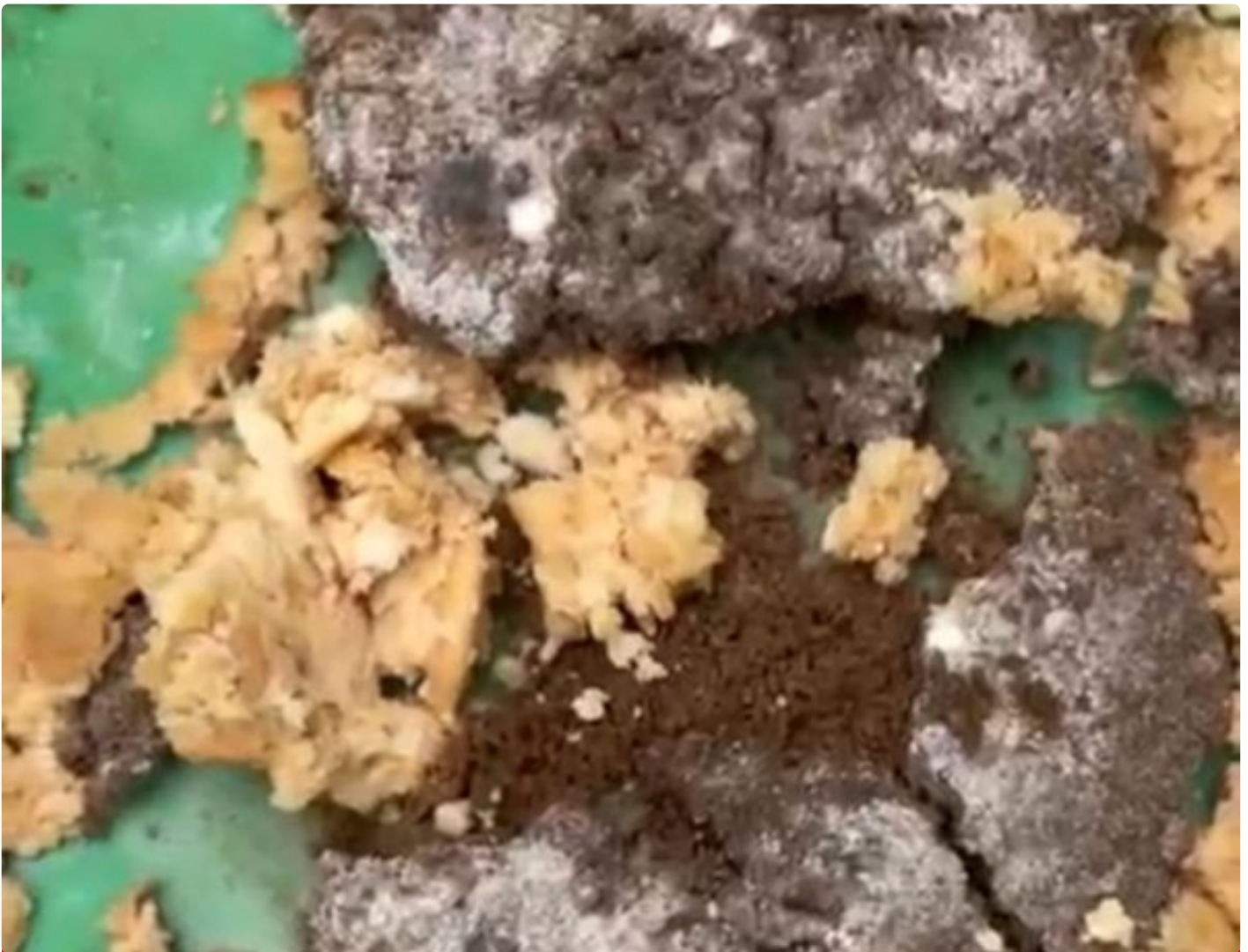
Rutan Wonosobo Lakukan Inisiasi Budidaya Maggot

Wonosobo — Rumah Tahanan Negara (Rutan) Kelas IIB Wonosobo terus mengembangkan program pembinaan kemandirian bagi Warga Binaan Pemasyarakatan (WBP). Salah satu inovasi yang saat ini dijalankan adalah budidaya maggot atau larva lalat Black Soldier Fly (BSF) yang dikelola secara terpadu dengan melibatkan petugas, WBP, serta peserta magang. (03/01).