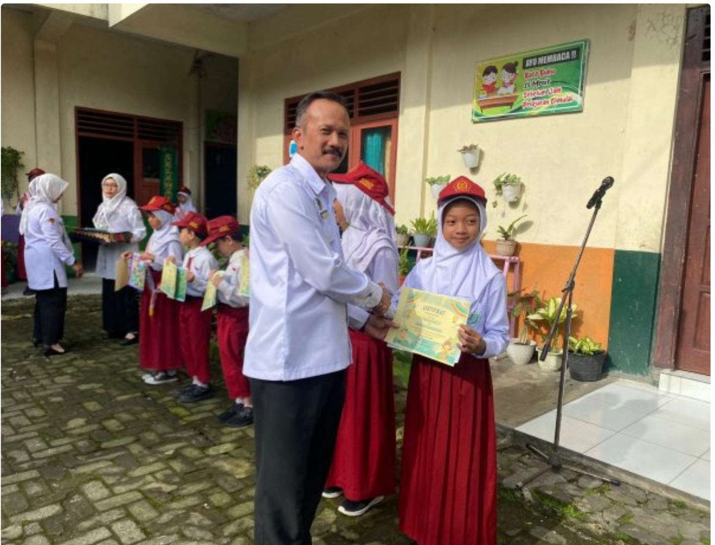
Safari Ramah Anak, Rutan Kelas IIB Wonosobo Tanamkan Inspirasi Positif di MI Ma'arif Kalianget